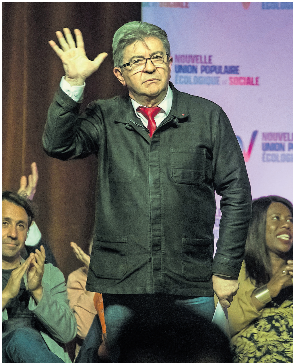
Steht sich selber im Weg: Jean-Luc Mélenchon.

Über ein halbes Jahrhundert ist Mélenchon schon im Politbetrieb. Mit 17 Jahren agierte er in den Studentenunruhen vom Mai 1968. Er neigte den Trotzlisten zu, aber nicht etwa der Hauptströmung, sondern der kleinen, sektiererischen «Organisation communiste internationaliste»